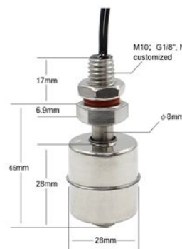
Рисунок 4.1 – Габаритные размеры

Подключение датчика схематично изображено на рисунке 4.2.